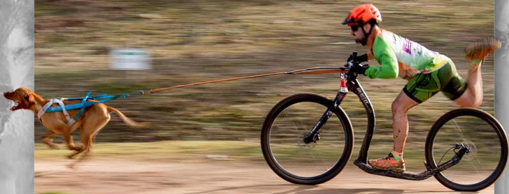
Fotografía: Congela el viento* de Juan Pablo Pascual Santos (ganadora Concurso de Fotografía Mushing Tierra de Dinosaurios 2024)

8-9 DE MARZO DE 2025 · SALAS DE LOS INFANTES · BURGOS