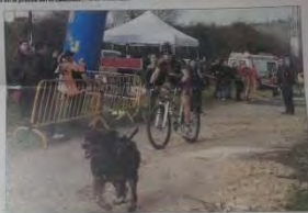
El canicrossista de Covarrubias pasa a ser un participante en la Copa de España.

En A. de la Cruz / Covarrubias. La villa de Covarrubias ha sido el escenario de varias competiciones de canicross. El domingo se celebró la prueba de la Copa de España y la participación en ella fue muy alta. Los participantes en esta prueba fueron los canicross de la zona de Burgos y los de la zona de Madrid. La prueba se celebró en la villa de Covarrubias, en el espacio que se ha convertido en un espacio para los perros. La prueba se celebró en la villa de Covarrubias, en el espacio que se ha convertido en un espacio para los perros. La prueba se celebró en la villa de Covarrubias, en el espacio que se ha convertido en un espacio para los perros.